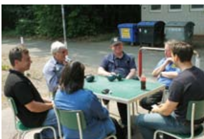
Zwischendurch war Zeit für Gespräche mit der Landesleitung in lockerer Runde.