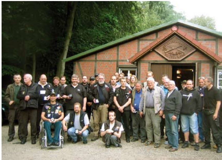
Die Landesmeisterschaft ZG 1 und ZG 4 war in diesem Jahr wieder gut besucht, was nicht zuletzt das gemeinsame Foto aller Schützen beweist.