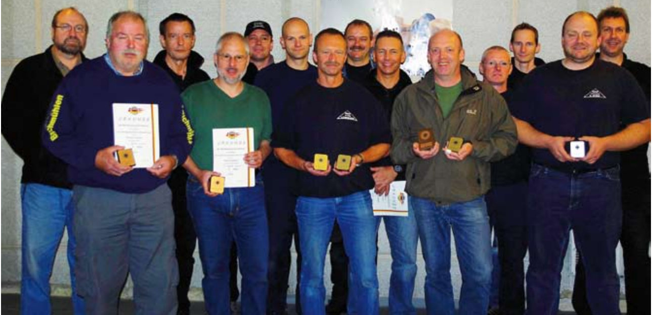
Mit gleich fünf von sechs Landesmeistertiteln bewies die SLG Big Bore Shooters aus Ilsede, dass sie bei den 1500ern eine Klasse für sich ist.

Die Landesmeisterschaft 1500 stand unter keinem guten Stern, zuerst wurde der Stand gesperrt und danach kamen zeitliche Probleme noch dazu, sodass die Landesmeisterschaft erst am 2.7. ausgerichtet werden konnte. Immerhin hat sich die Firma Glock (Austria) wieder als verlässlicher Sponsor erwiesen. Aschera weigerte sich standhaft