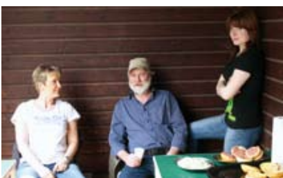
Das „Team für den kleinen Hunger“ gab sein Bestes.