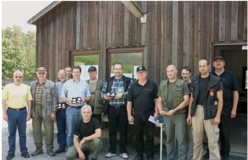
Die Dienstgewehrschützen mussten in diesem Jahr für ihre Landesmeisterschaft viel Geduld mitbringen.