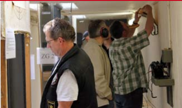
Beim Warten auf den nächsten Schuss – Deckungsarbeit will gelernt sein.