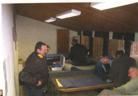
Wettkampf am 50-Meter-Stand mit Aufsicht.