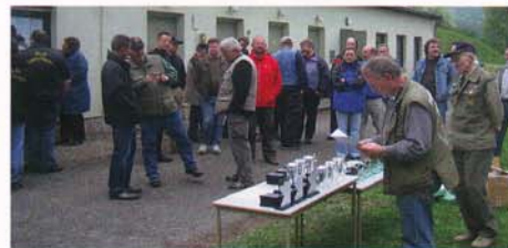
Siegerehrung im kleinen Kreis mit dem Landessportleiter.