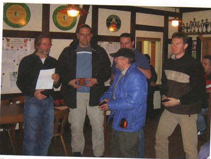
Die Mannschaft der SLG Hannover-Mitte konnte sich den ersten Platz bei der Repetierflinte 2 und Doppelflinte 2 sichern. Bei der Selbstladeflinte wurde sie von der SLG Göttingen auf Platz zwei verdrängt.