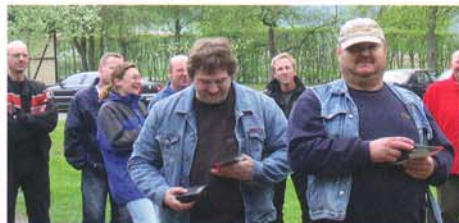
Die erfolgreichen Schützen der SLG Big Bore Shooters.