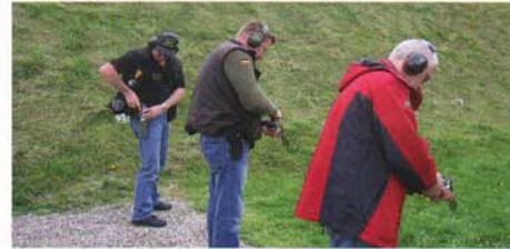
Vorbereitung auf den Supermagnum-Wettkampf.