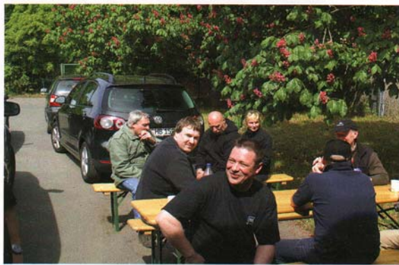
Bei bestem Wetter tat auch das Warten auf die Siegerehrung der guten Stimmung keinen Abbruch.