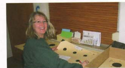
Ein freundliches Lächeln bei der Scheibenauswertung tröstet bei nicht ganz so guten Ergebnissen.