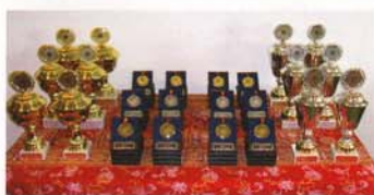
Attraktive Auszeichnungen winkten den siegreichen Schützen.

Text und Fotos: Klaus Müller, Referent LAR/SAR