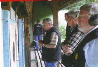
Jeder Ring zählt: Auf den zweimal 15 Bahnen des Schießstandes in Warendorf herrschte Hochbetrieb.