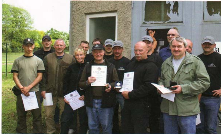
Bereits am Nachmittag konnten die Sieger ihre Urkunden entgegennehmen. Dazu gab es wertvolle Sachpreise.

Durch einen „guten Draht“ der SLG Harz konnten auch attraktive zusätzliche Sachpreise vergeben