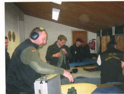
... oder Unterlagen und Decken gegen die Kälte, um die Ergebnisse nicht witterungsbedingt zu gefährden.