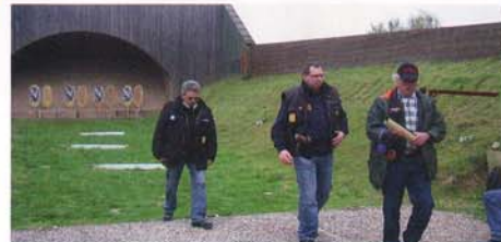
Alles unter Kontrolle: die Aufsichten in Hameln-Holtensen.