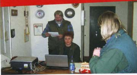
Flinke Hände sorgten für eine schnelle Erfassung der Ergebnisse.