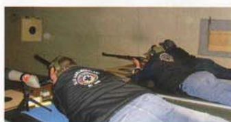
Schützen der gut platzierten SLG Harlingerland.