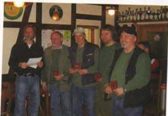
Die Mannschaft der SLG Hameln konnte sich einen Platz in den Rängen sichern.