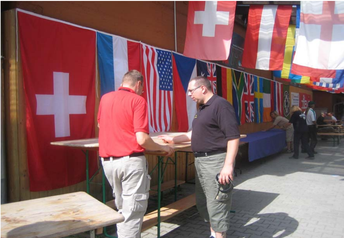
vorbereitungen für die Siegerehrung