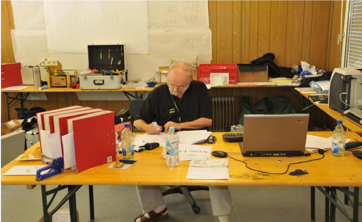
es hat alles geklappt.....auch die Sicherungskopien....