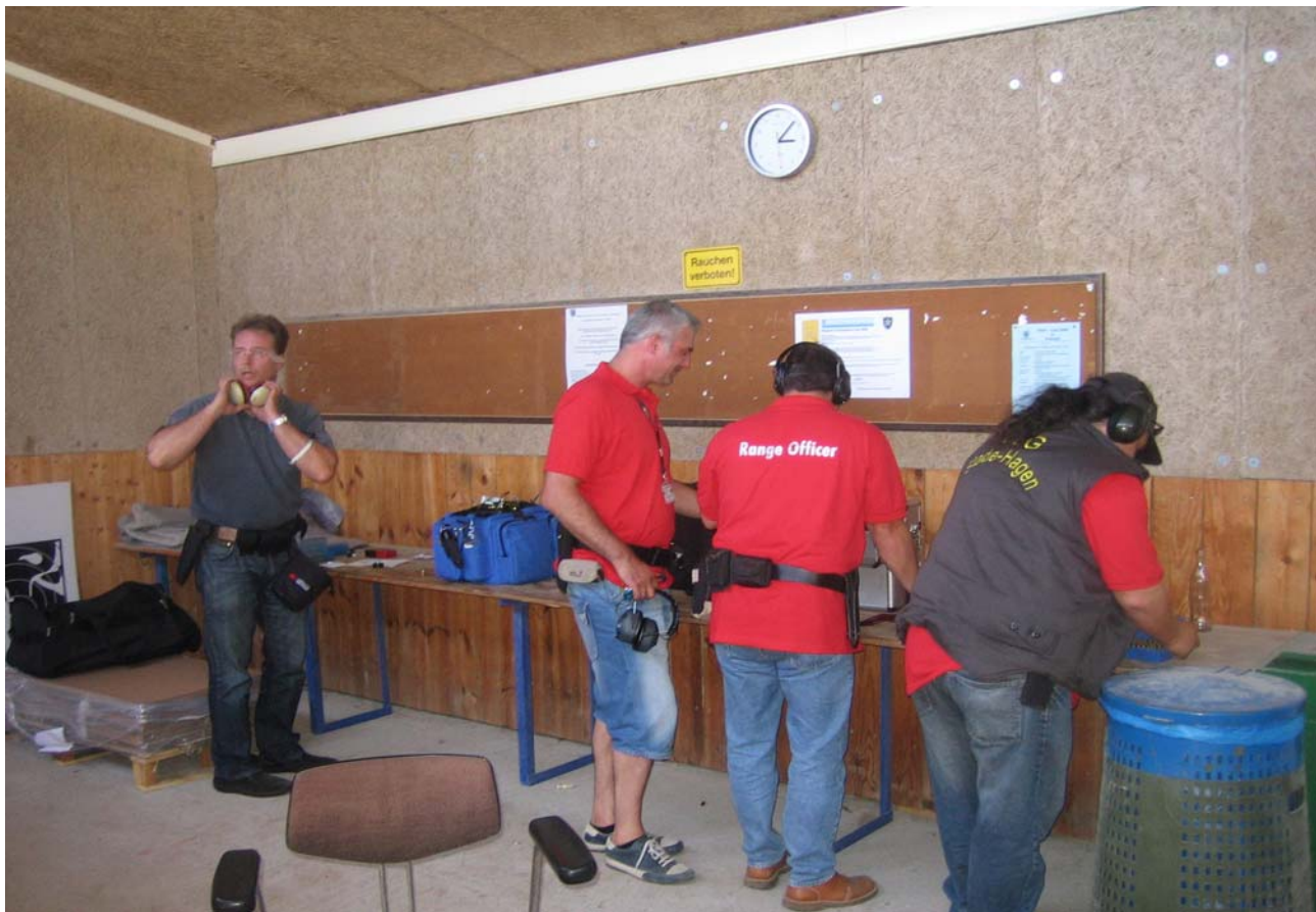
erst Ro dann selber schießen