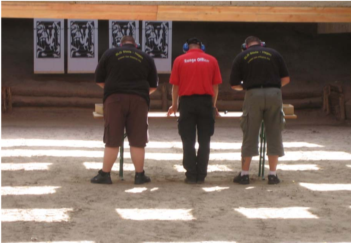
unsere beiden Hoffnungsträger