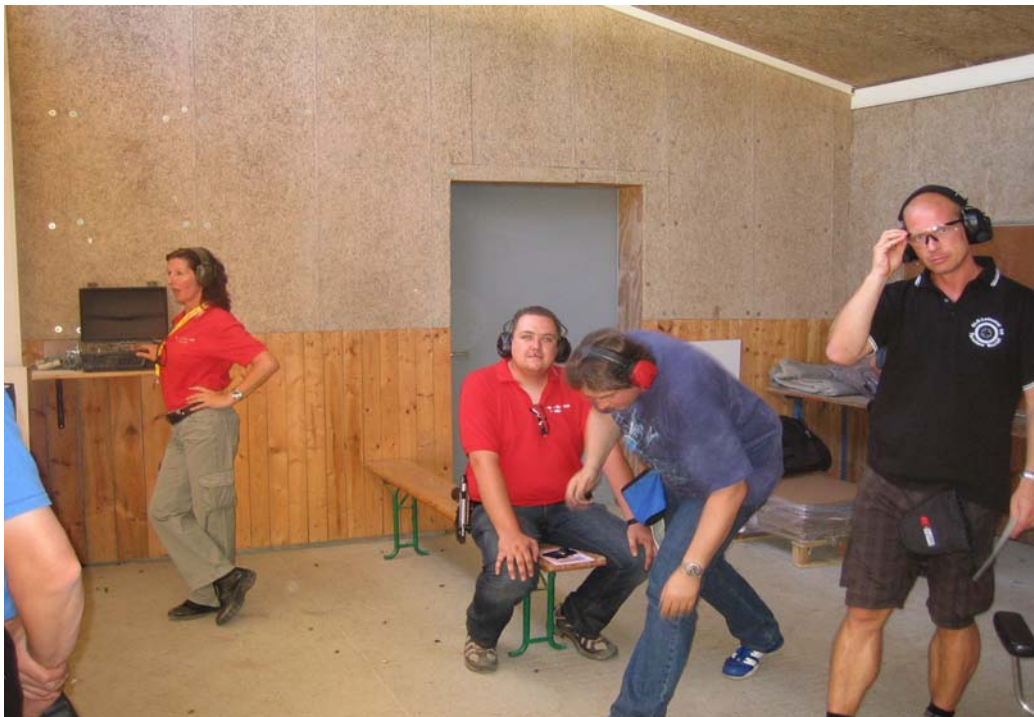
er bekam ein gutes Zeugnis .....