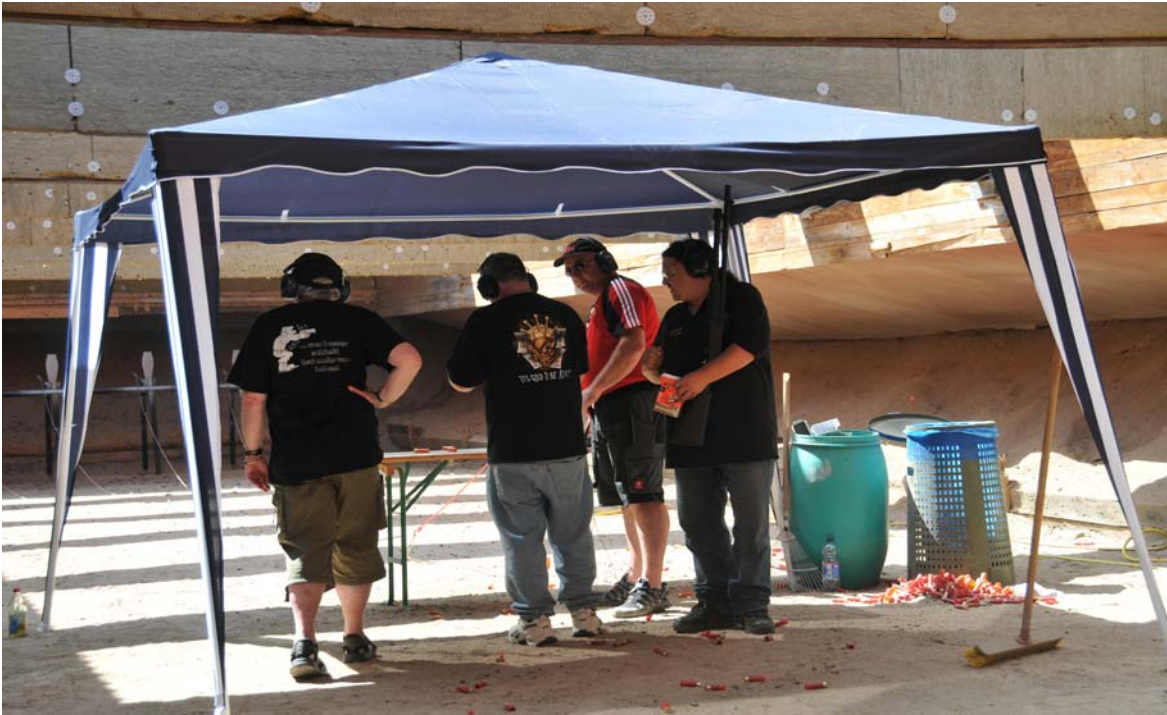
mit Schrot auf Klappscheiben