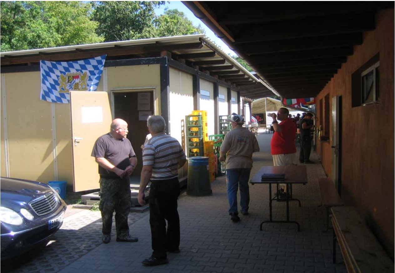
endlich ein wenig Erfrischung ....