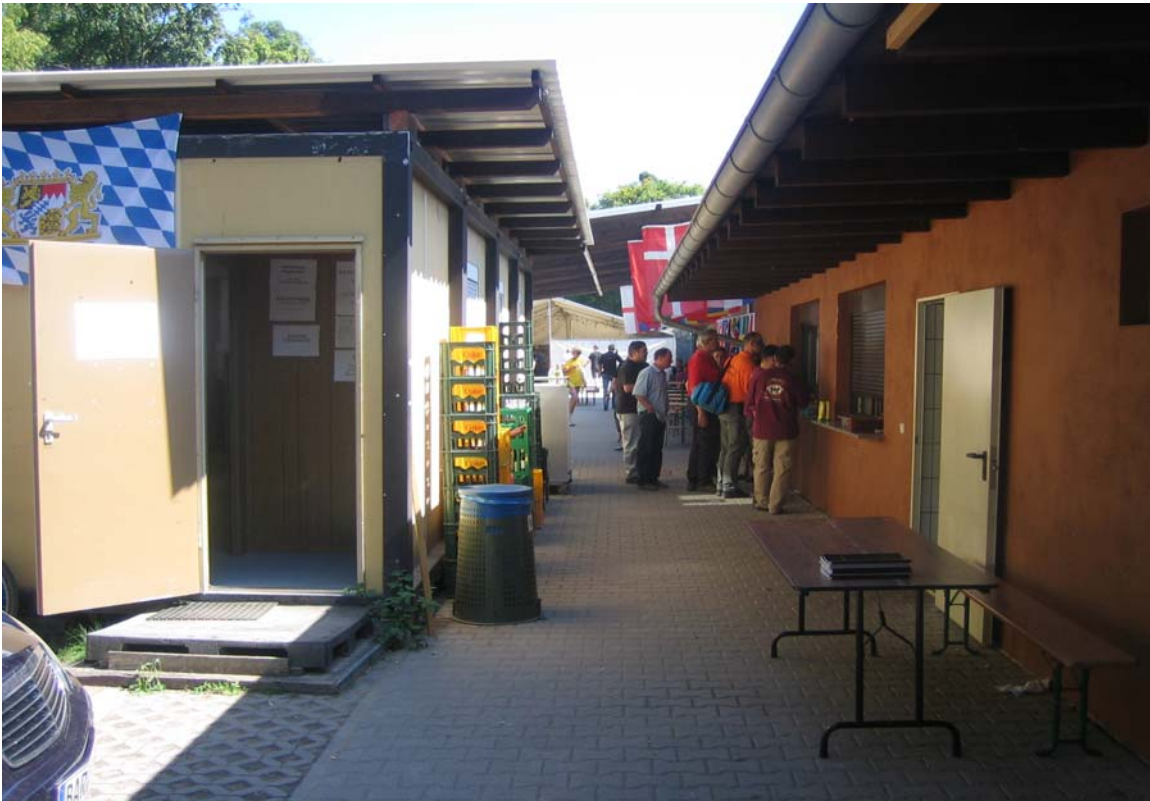
der Container, mein Arbeitsplatz für die nächsten zwei Tage