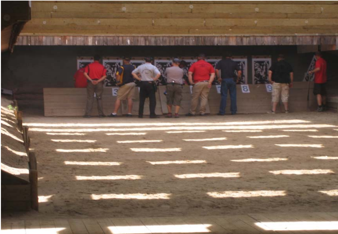
ein super Stand in Philippsburg