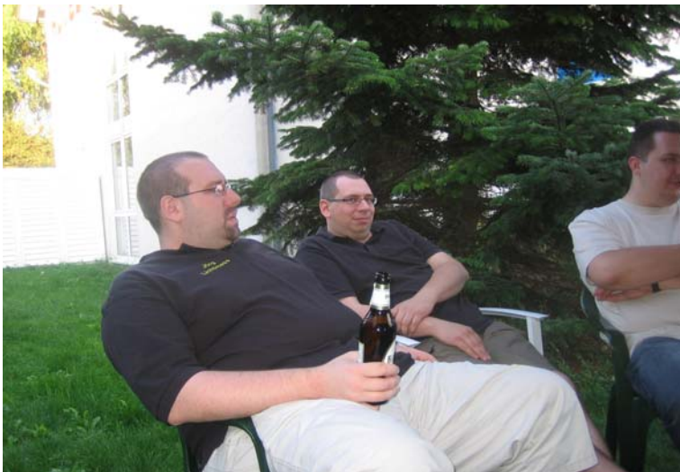
abends im Hotel .....