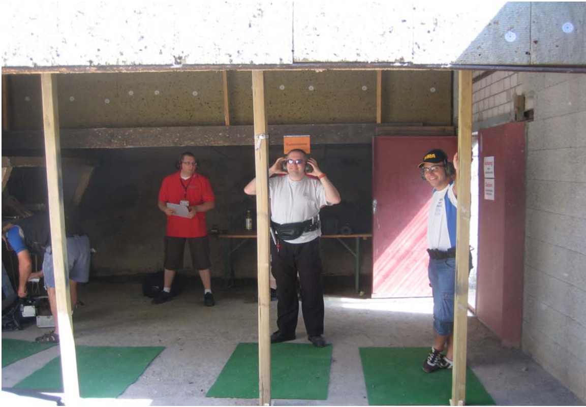
zum ersten Mal Ro