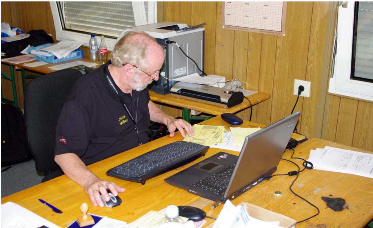
hier liefen die Ergebnisse zusammen