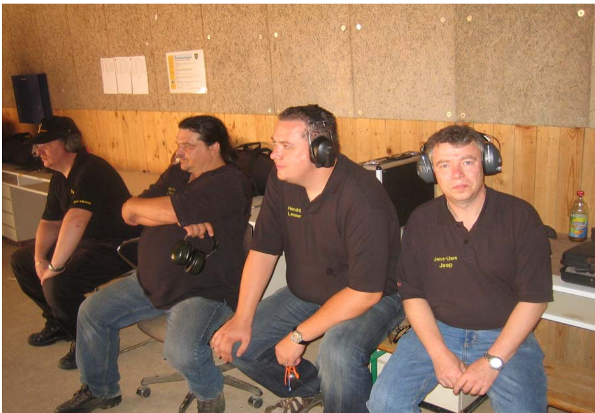
warten auf die eigenen Starts