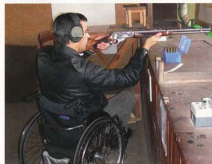
LAR im Rolli: volle Konzentration.