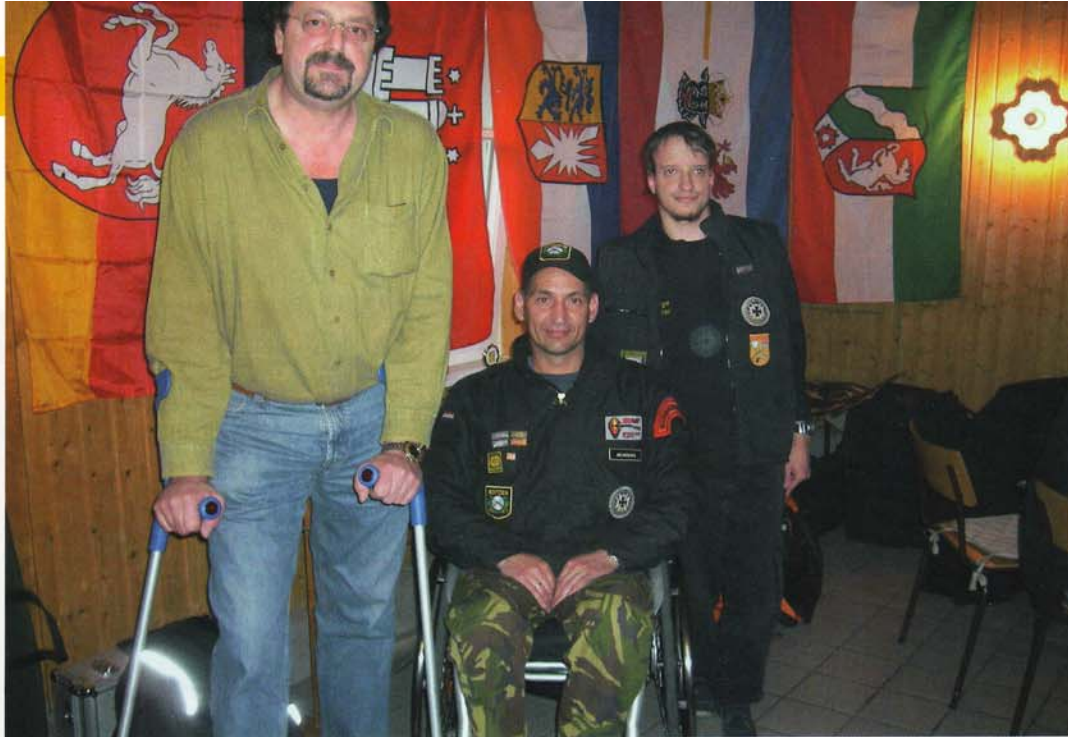
Schießen mit Handicap: kein Problem für die Sportschützen im BDMP. In die Sportordnung wurde eigens ein Passus aufgenommen.